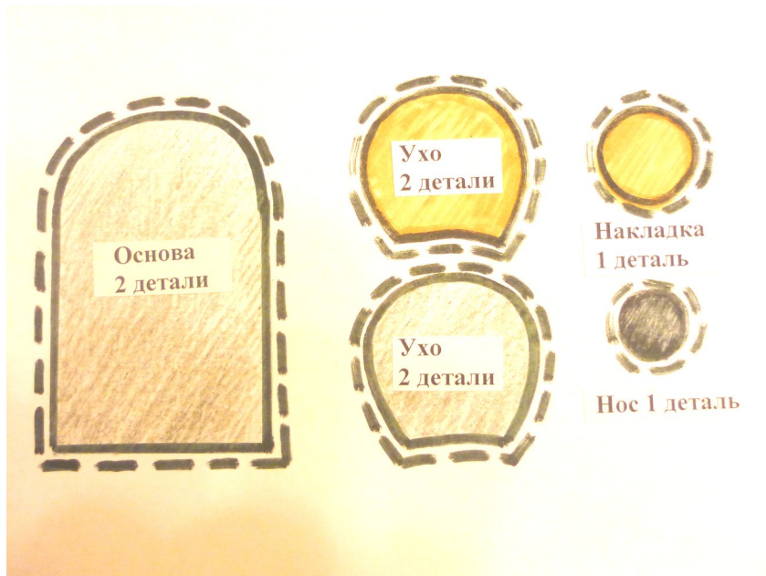
Рис.5. Бумажные шаблоны для пальчиковой куклы «Мышка»

Детали ушей, предварительно сшитые, и хвост, выполненный из ниток для вязания (или сшитый), вставляем между двух половинок основы, прошиваем по контуру туловища швом «назад иголка» (рис. 6).