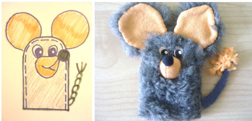
Рис.4. Схема и фотография готовой пальчиковой куклы «Мышка»

Остальных героев сказки «Бабку», «Курочку Рябу» и «Яичко» делаем аналогично. Бумажные шаблоны разрабатываем самостоятельно на основе уже имеющихся образцов. Подбор материалов и выполнение деталей осуществляем исходя из знаний об их свойствах и необходимых визуальных качеств. Фотографии всех готовых пальчиковых кукол сказки «Курочка ряба» можно найти в Приложении 1 .