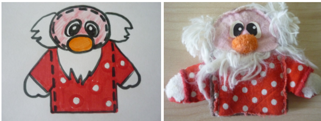
Рис.4. Схема и фотография готовой пальчиковой куклы «Дед»

Нос-шарик, выполненный из кружочка, обшито по контуру нитками простым косым швом «через край» и стянутого по окружности, пришиваем потайными стежками к лицу игрушки. Вырезаем глазки в виде овалов из черной и белой бумаги. Приклеиваем их к лицу. Для глаз и носа можно использовать бисер или бусины, которые пришиваем или приклеиваем. Также мелкие детали игрушки (нос, глаза, брови, усы) можно вышить нитками мулине (рис. 4).