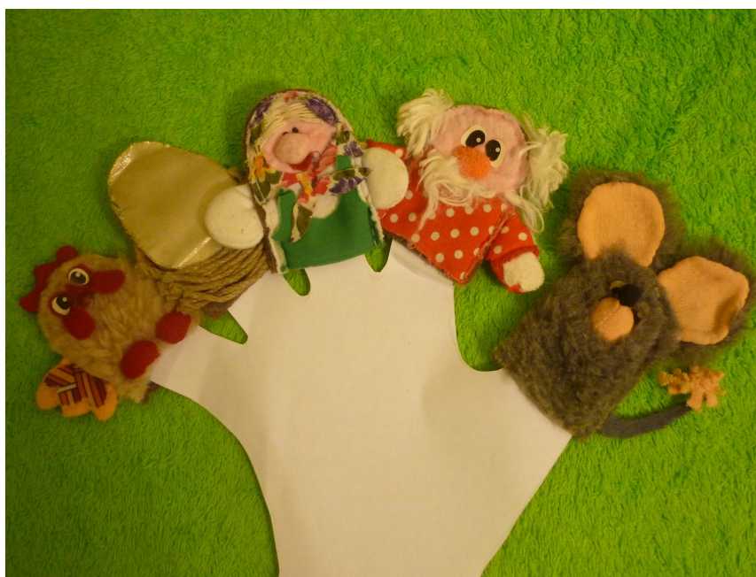
Рис.1. Пальчиковые куклы для сказки «Курочка Ряба»

Учебно-практическое издание предназначено для учащихся первого года обучения детского объединения «Умелицы» для успешного освоения теоретического и практического материала раздела «Пальчиковые игрушки» и является частью УМК программы обучения. Материал снабжен иллюстрациями, детальным описанием хода работы и отдельных этапов. Сложность задания и методы его выполнения ориентированы на соответствующий возраст и уровень подготовки детей. Также издание снабжено исторической информацией о значении и разновидностях пальчиковых игрушек и, позволяя закрепить полученные знания, умения и навыки, оставляет достаточно пространства для творческой свободы и личной интерпретации. Итогом освоения раздела является театрализация сказки «Курочка Ряба» при помощи пальчиковых персонажей, сшитых своими руками (рис. 1).