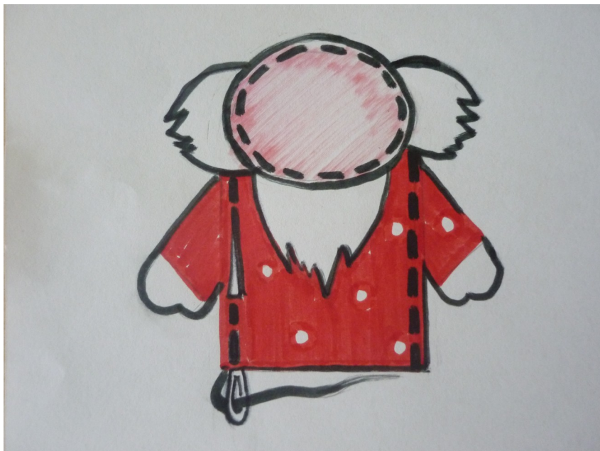
Рис.3. Схема соединения основных деталей пальчиковой куклы «Дед»

Нос-шарик, выполненный из кружочка, обшито по контуру нитками простым косым швом «через край» и стянутого по окружности, пришиваем потайными стежками к лицу игрушки. Вырезаем глазки в виде овалов из черной и белой бумаги. Приклеиваем их к лицу. Для глаз и носа можно использовать бисер или бусины, которые пришиваем или приклеиваем. Также мелкие детали игрушки (нос, глаза, брови, усы) можно вышить нитками мулине (рис. 4).