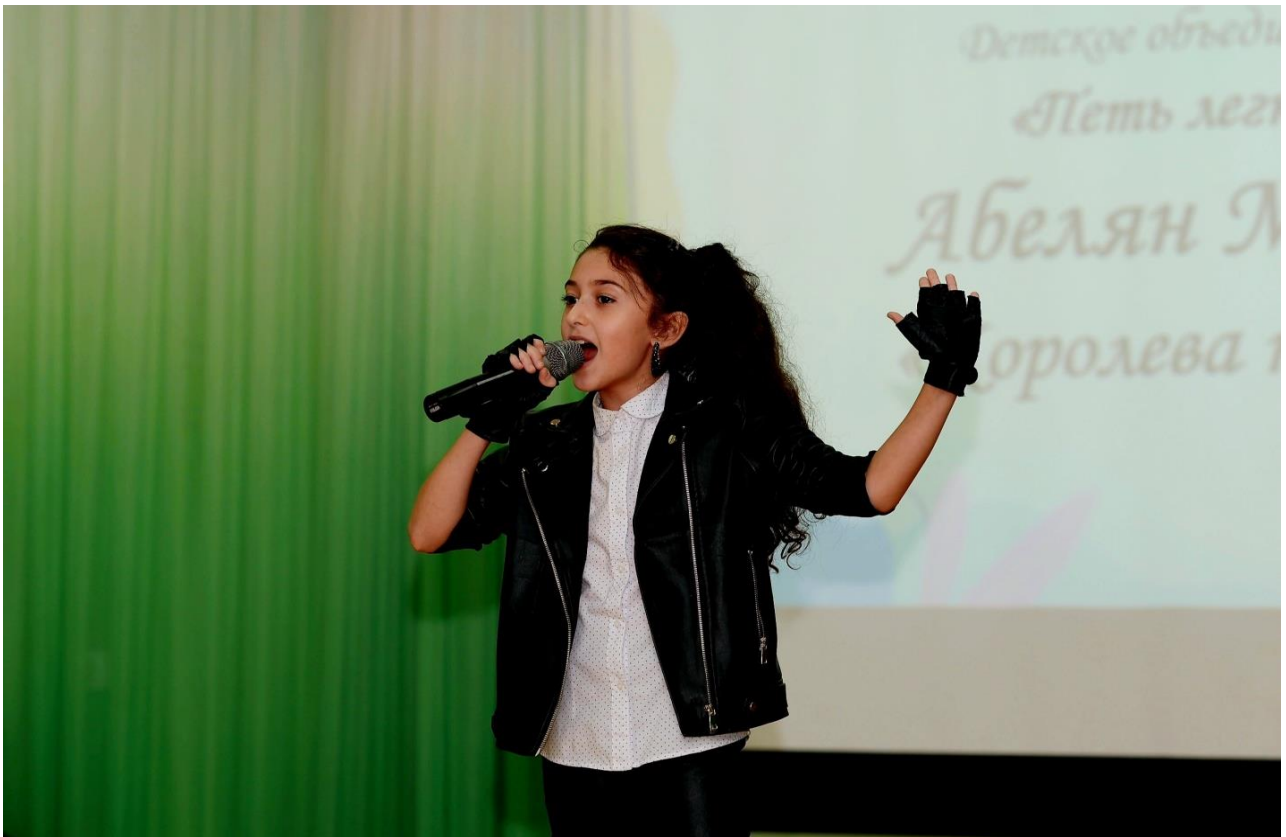
д/о Петль легко