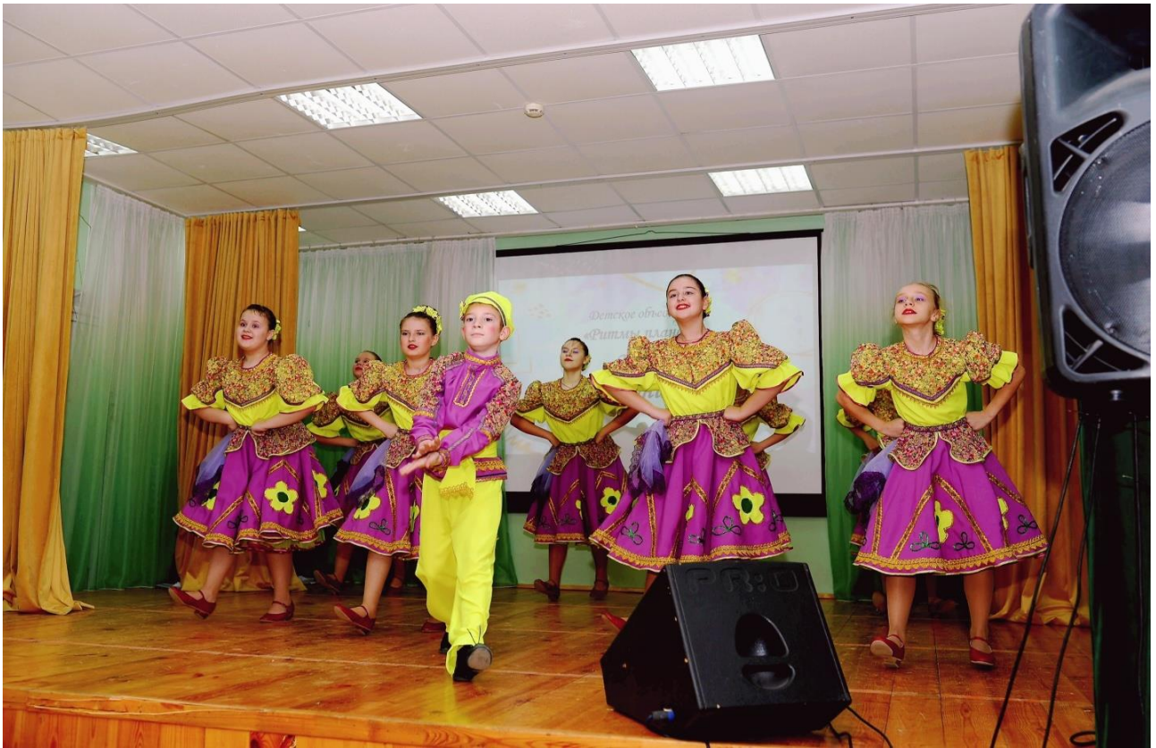
д/о Ритмы планеты