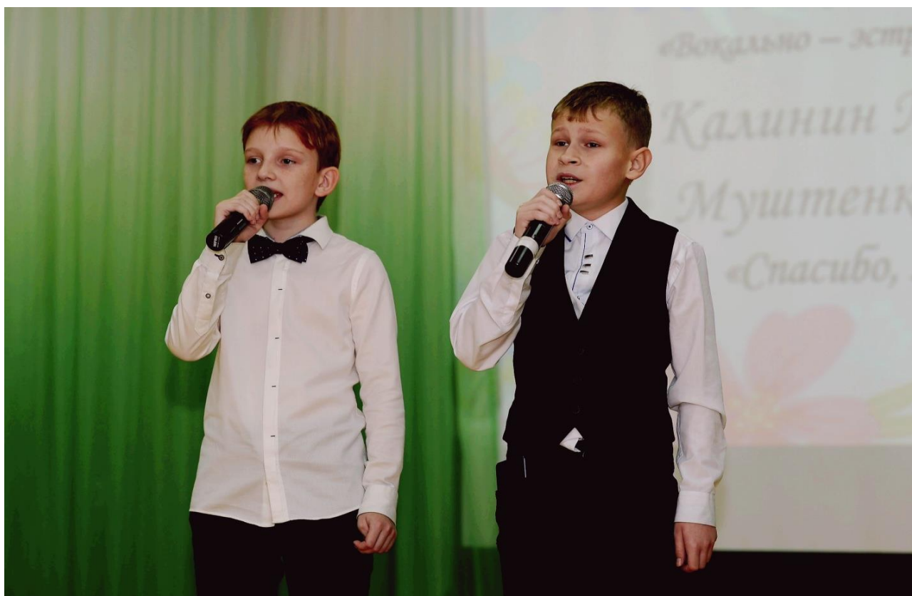
д/ Вокально-эстрадное пение