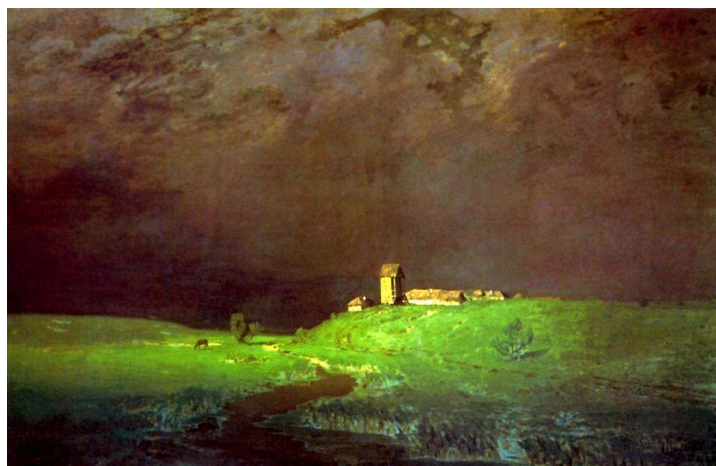
А.И. Куинджи «После дождя»