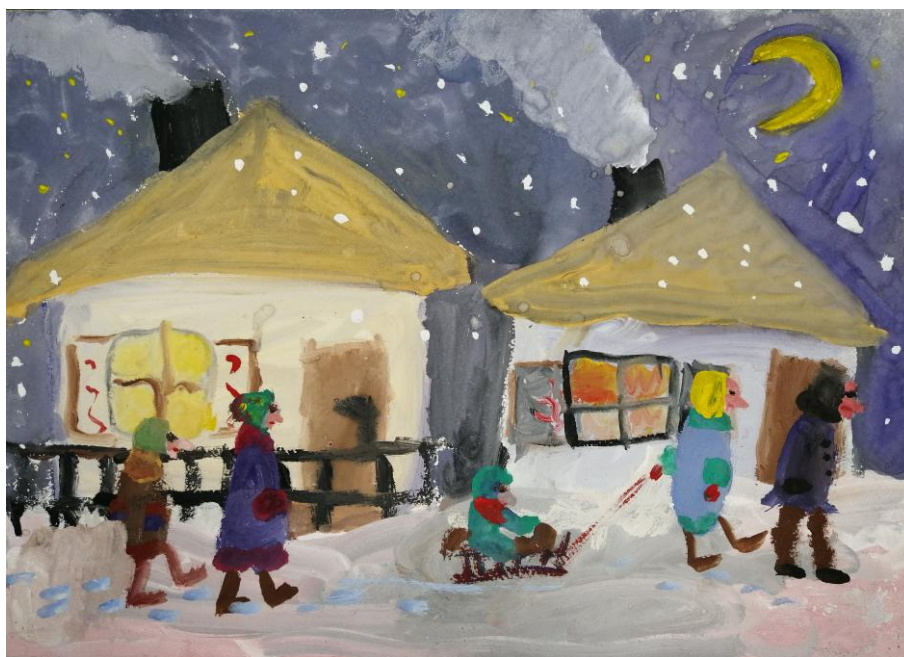
Вечер на хуторе Фомина Ульяна, 6 лет