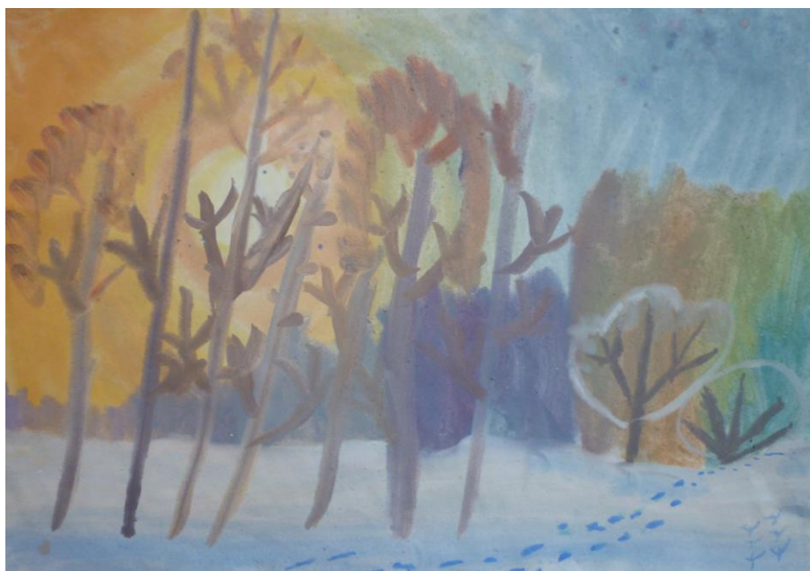
Зимнее солнце Козменков Даниил, 7 лет