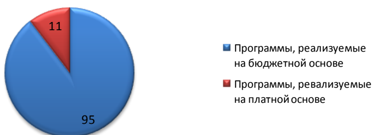
Доля программ, реализуемых в рамках дополнительных образовательных платных услуг в общем количестве программ