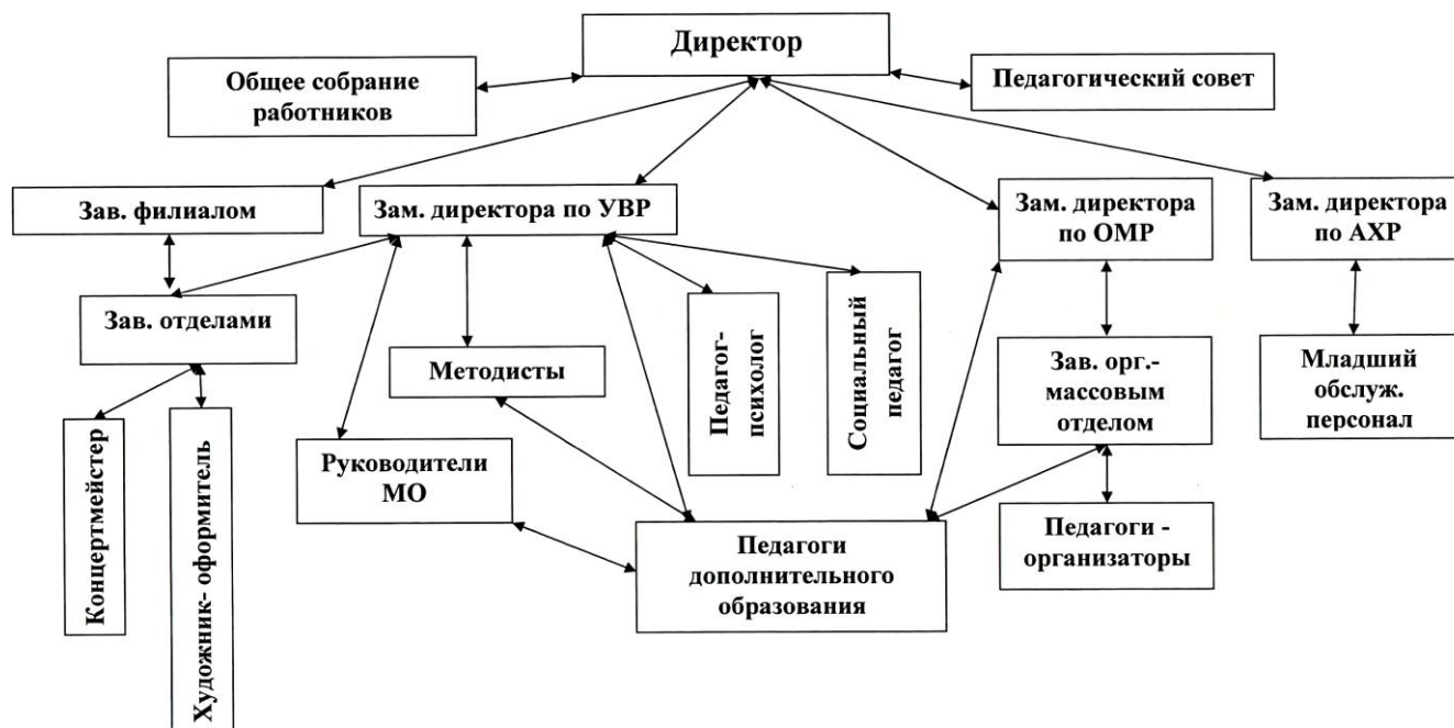
СТРУКТУРА УПРАВЛЕНИЯ ДЕЯТЕЛЬНОСТЬЮ МБУДО «ДОМ ДЕТСКОГО ТВОРЧЕСТВА ЖЕЛЕЗНОДОРОЖНОГО ОКРУГА»

В управляющей системе функционируют постоянно действующие коллегиальные органы управления учреждением – общее собрание работников, педагогический совет; совещательные органы – Совет родителей (законных представителей), Совет учащихся.